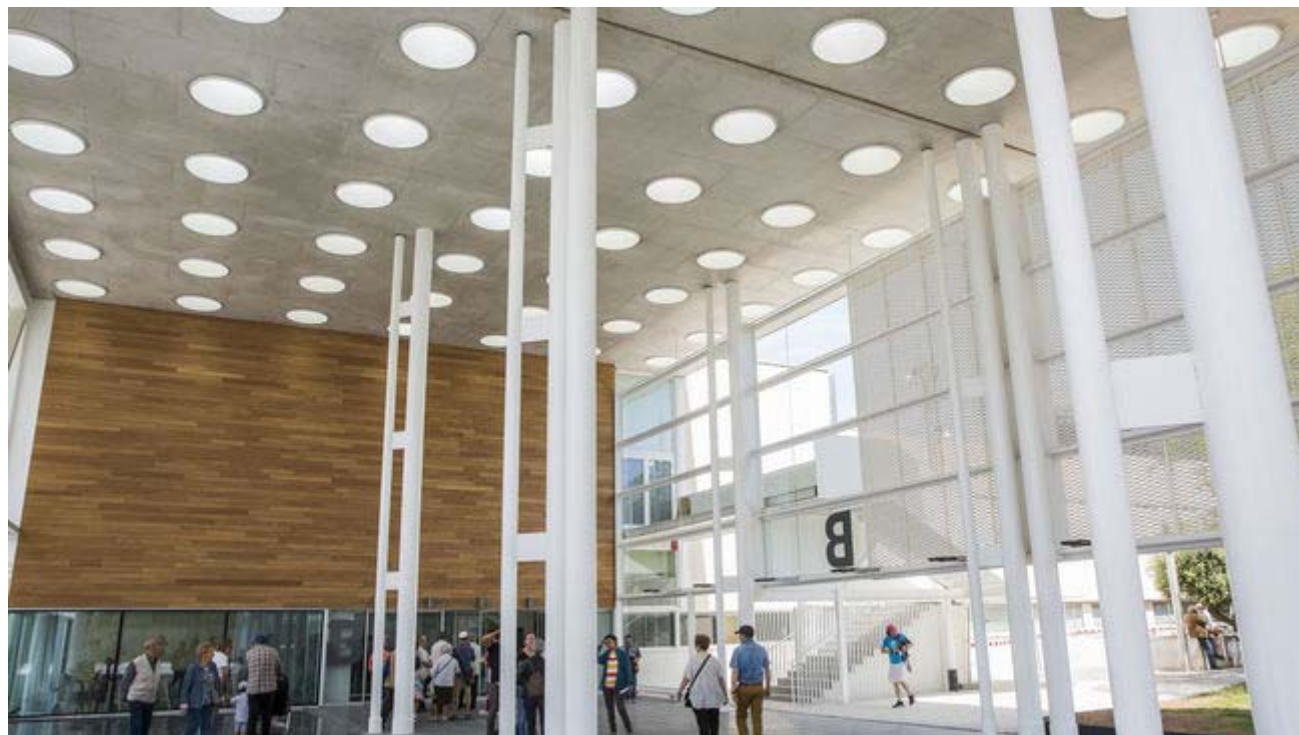
L'Hospital del Mar estrena el seu nou edifici, de 16.000 metres quadrats

EFE BARCELONA | ACTUALITZADA EL 21/05/2017 14:27