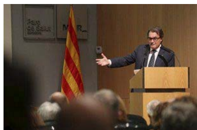
El president Mas, en un moment del seu parlament

Ambdues institucions aporten 72 milions per a la represa de l'ampliació de l'hospital i 66 milions per eixugar el deute acumulat pel complex des del 2008